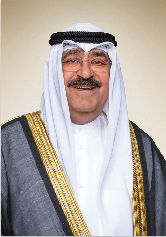
صاحب السمو الشيخ مشيخة الامام الجابر الصباح ولي عهد دولة الكويت