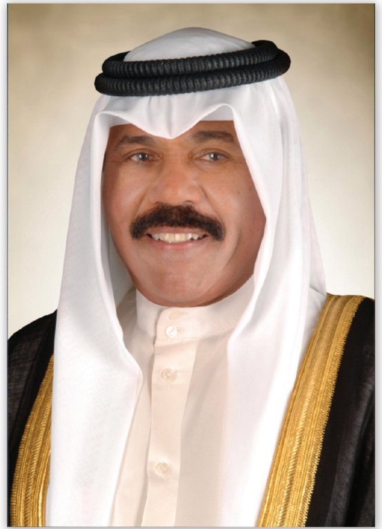
صاحب السمو الشيخ نواف الاحمد الجابر الصباح امير دولة الكويت